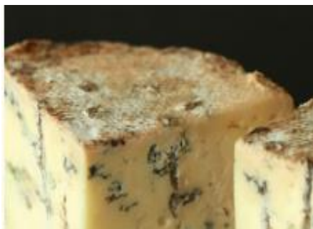
BLEU DE LA MOUTONNIÈRE 3 KG