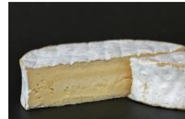
RIOPELLE DE L'ISLE 1,3 KG