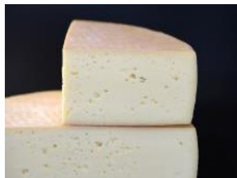
LE MONT JACOB 2,4 KG / 8 X 130 G