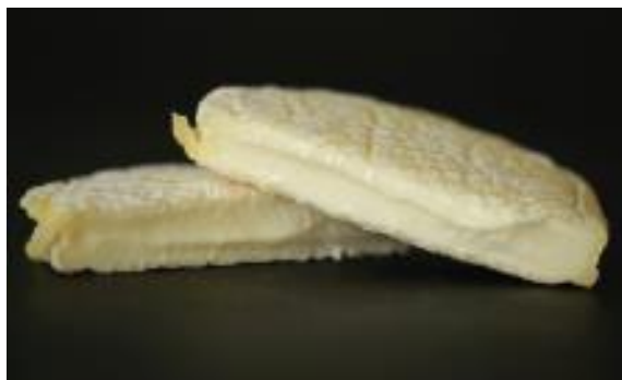
LE CHÈVRE À MA MANIÈRE 4 X 180 G