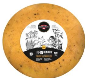
FIN RENARD FIN RENARD AU TRUFFE 4 KG