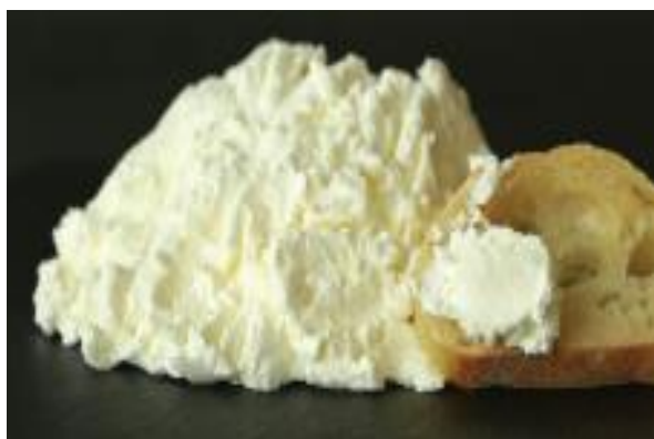
LA BEURASSE 1 KG