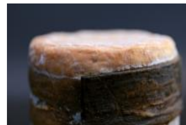
ADORAY 5 X 250 G