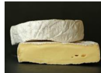
LE FLEURMIER 12 X 250 G