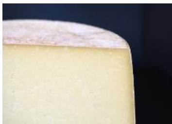
LE BLACKBURN 9 KG / X 130 G

VACHE – BAIE-SAINT-PAUL, BEDFORD, JONQUIÈRE, MONTEBELLO, REPENTIGNY, SAINT-ANTOINE DE TILLY, ISLES-AUX-GRUES,