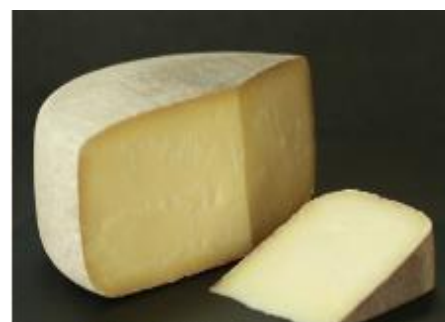
FLEURS DES MONTS 3 MOIS 4 KG