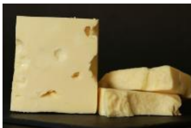
EMMENTHAL DE CHARLEVOIX 3 KG