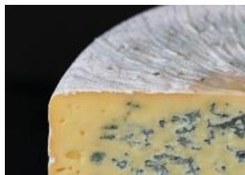
LE CIEL DE CHARLEVOIX 2,5 KG