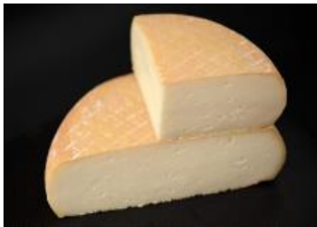
LE BERCAIL 1,7 KG