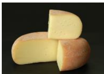
LE CENDRÉ DES GRANDS JARDINS 2.6 KG