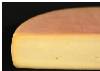
LE MIGNERON 2,5 KG