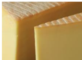
LE 1608 12 X 170 GR