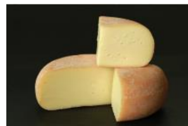
LE BOCKÉ 400 G