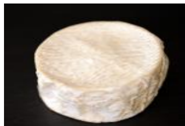
LE JERSEY ROYAL 5 X 200 G