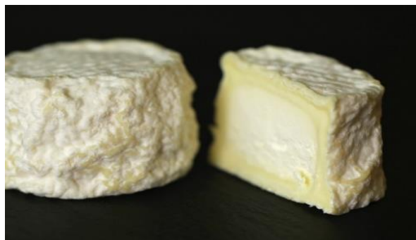
LE CROTTIN À MA MANIÈRE 12 X 80 G