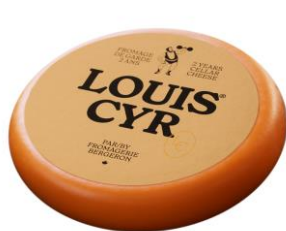
LOUIS CYR LOUIS CYR – 2 ANS 4 KG