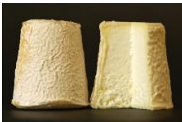
LE MONSIEUR ÉMILE 6 X 180 GR 180 GR