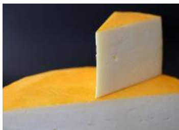
LE CABOURON 2.8 KG / 8 X 130 G