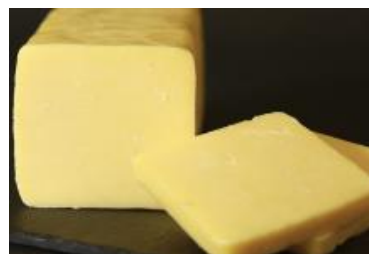
CHEDDAR-ILES-AUX- GRUES 2 ANS 2,3 KG / 275 G